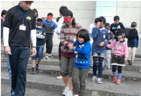
11月15日 福祉体験(九保大) 点字やアイマスク体験等を通して、目の不自由な方への接し方や福祉の心を学びました。