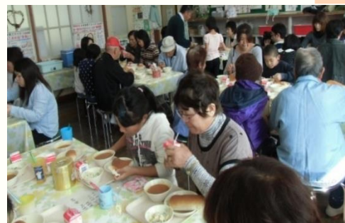
11月1日 オープンスクール 参観授業、3世代交流グラウンドゴルフ、お話し会、給食試食会で地域の方々との交流を深めました。