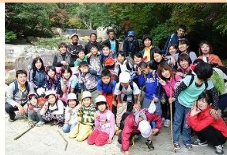
11月8日 秋の親子遠足 御手洗溪谷まで徒歩で行き、三槿のよさを実感しました。