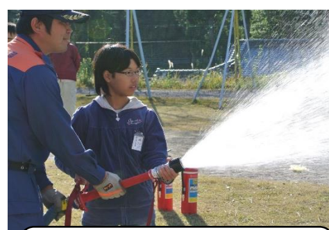
11月22日 火災避難訓練 消火活動 これから寒くなりますが火の取り扱いに注意します。