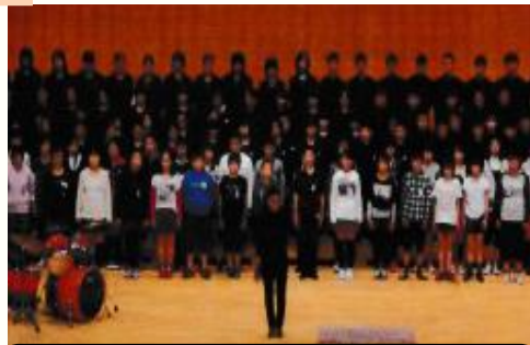
11月14日 小中合同音楽祭 北方中学校全生徒とともに北方小6年生三槿、城、美々地小5・6年生が参加しました。