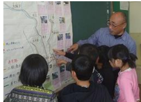
11月20日 通学路アドバイザーの方との安全学習 3・4年生が作成した通学路安全マップを発表しました。