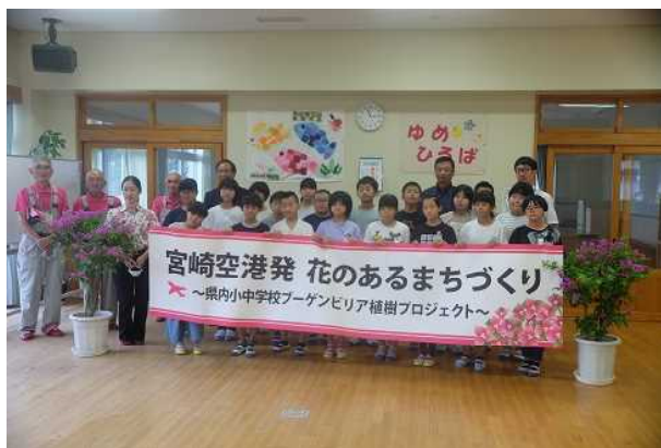
【贈呈式後に記念撮影】

ブーゲンビリアの花言葉は「情熱」、「魅力」などの意味があります。本校もブーゲンビリアのように「情熱・魅力」ある学校を目指してがんばっていききたいと思います。