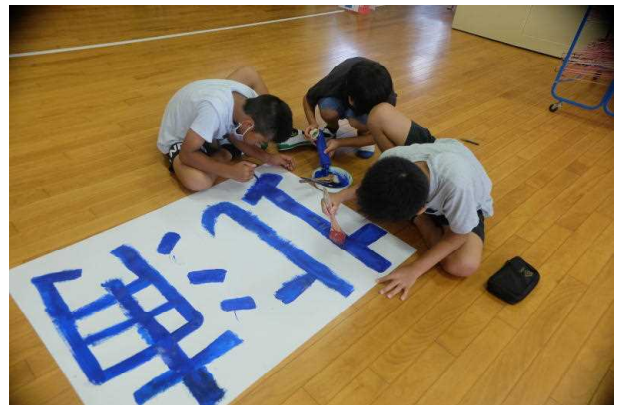
【スローガンの掲示作成】