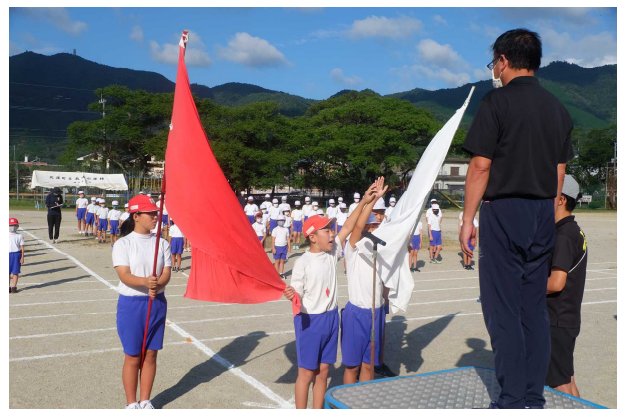
【児童代表誓いの言葉】