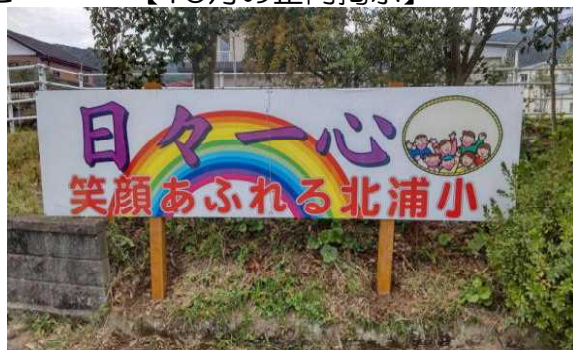
【改修した正門看板】