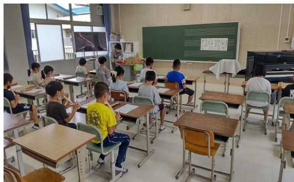
【新しくなった音楽室】

これから子どもたちは、新しくなった音楽室で意欲的に音楽の授業に取り組んでいくと思います。