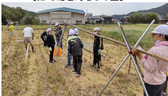
【稲穂を干す竿の設置】