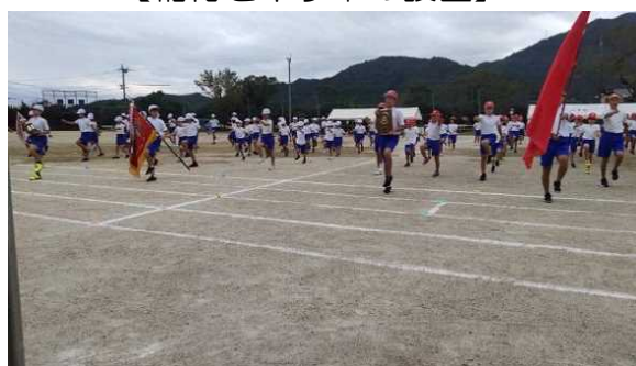
【入場する白団・赤団の勇姿】

また保護者の皆様方には、運動会の準備や片付けなどいろいろとご協力をいただくこととなりますが、どうぞよろしくお願いたします。