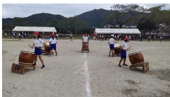
【北浦音頭の太鼓演奏】