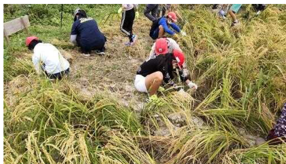
【鎌で稲を刈る5年生】

28日の1年生から4年生が遠足の時に、お米を炊いて食べるそうです。釜で炊くご飯は最高においしいですので、楽しみです。