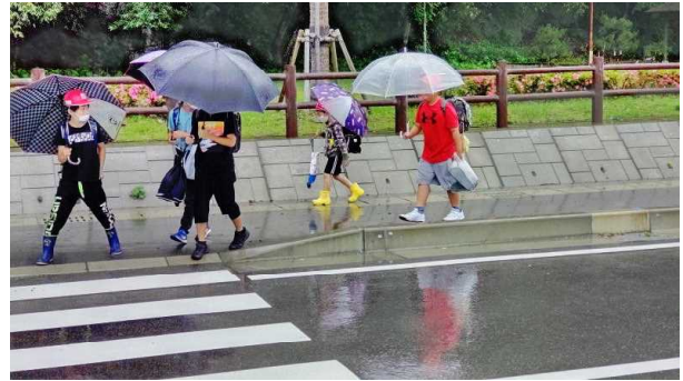
【雨の日の登校の様子】