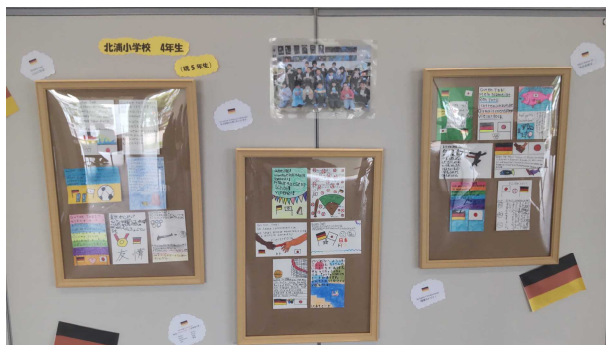
【市役所に掲示された児童の葉書】