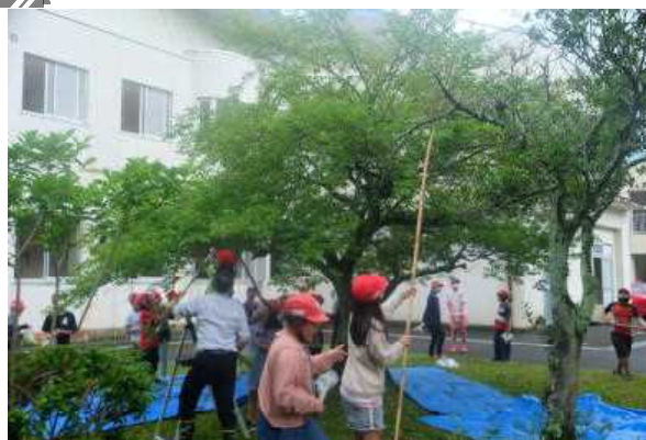
【 4年生の作業の様子 】