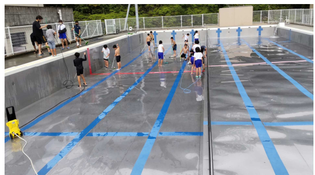
【 プール清掃の様子 】