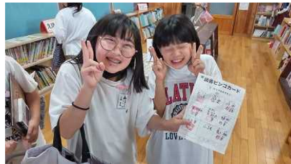
【ビンゴ！ビンゴ！ビンゴ！！】