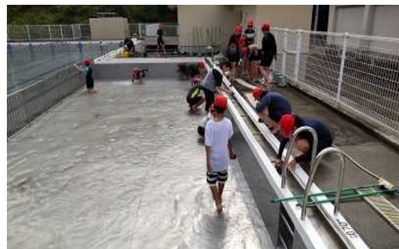
【プール清掃の様子】

6月の末には水泳が始まります。ということで、高学年がプール清掃を行いました。小プールを5年生が担当し、プールの壁や底、溝を一生懸命掃除しました。天気が曇っていたので、少し肌寒い感じでしたが、みんな頑張ってピカピカなプールに変わっていました。さすが5年生！これで低学年のみんなが楽しく泳ぐことができますね。楽しみ楽しみ！