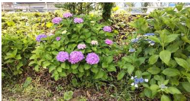
【梅雨を待つ本物のあじさい】