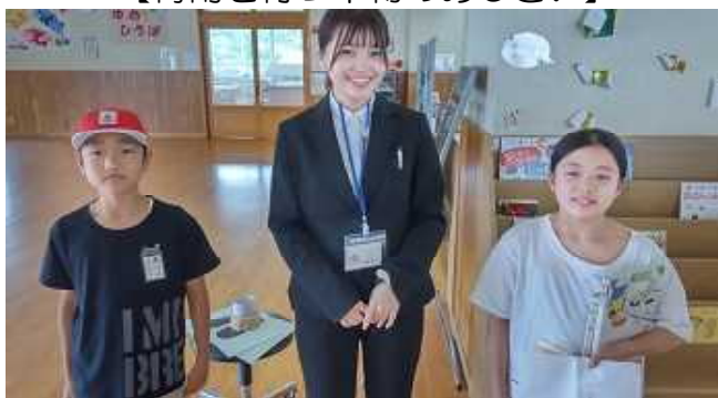
【子どもたちとパチリ！】