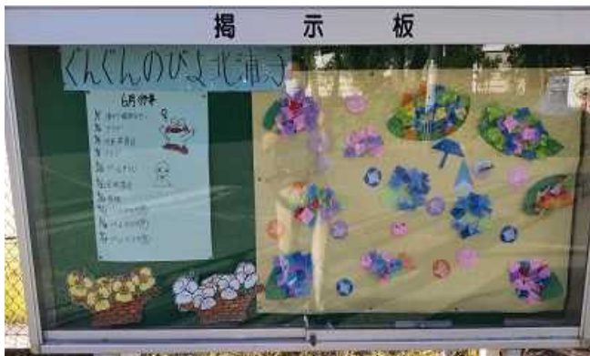
【5年生が製作したあじさい】

ちなみに私も33年前に東海中学校で教育実習を行いました。授業や部活動などとてもハードでしたが、そのときのことを今でも鮮明に覚えています。