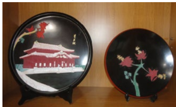
平成4年(左)と昭和57年(右)の寄贈品

平成4年の訪問の際は、沖縄に帰郷されてから本校児童に向けてお礼の手紙を書かれ、右の写真のように文集にして送っていただいています。疎開当時の生活の様子やその後の人生などが記されています。