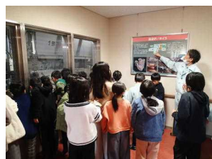
延岡クリーンセンター