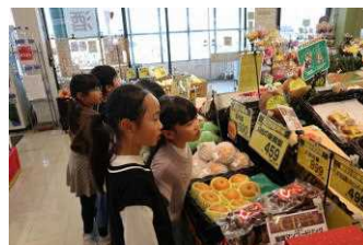
マルミヤストア松山店