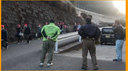
見守り隊・生活環境部