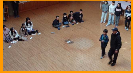
専門講師によるロボット・太陽系・ドローンの特別授業