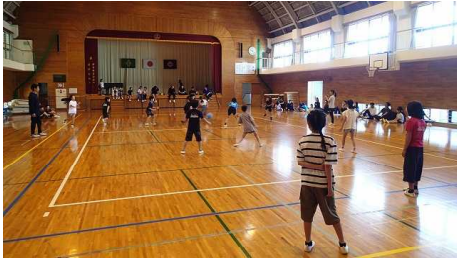
6/7 親子ドッジボール大会