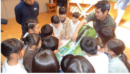
6/4 土砂災害防止教室