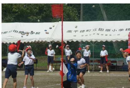
団技「力を合わせて勝利をめざせ」 （1～6年生）