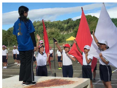
「選手宣誓」 （団長・副団長）