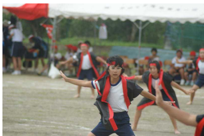
「田原っ子ソーラン節2019秋」 （5・6年生）