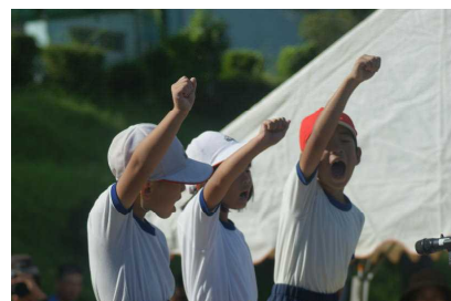
「誓いのことば」 （1年生）