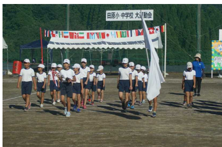
「入場行進」 （全校児童・生徒）

この運動会を通して、 児童一人一人が味わった感動、気付いたこと、学んだことなどをしっかり胸に刻み、これからの生活に生かして欲しい と思います。また、応援してくださった皆様への 感謝の気持ち を決して忘れないで欲しいと思います。