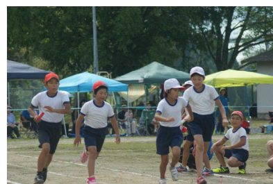
「団対抗全員リレー」 （1～6年生）