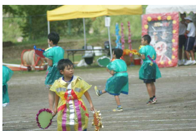
「田原っ子ダンス&スマイル」 （1～4年生）