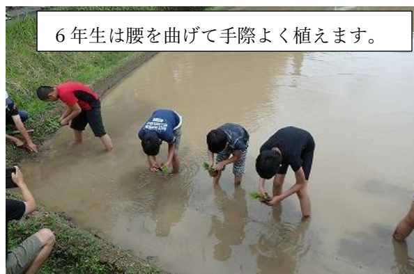
6年生は腰を曲げて手際よく植えます。