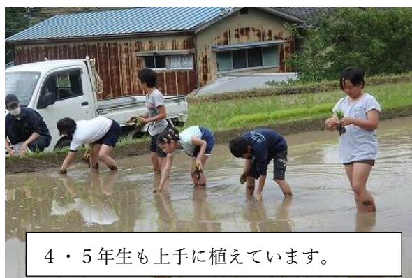
4・5年生も上手に植えています。