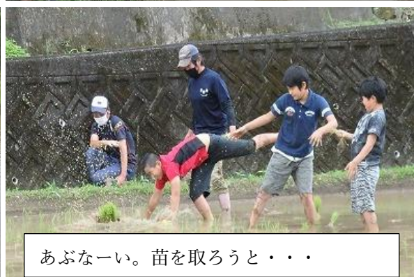
あぶない。苗を取ろうと・・・