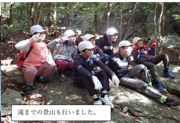
滝までの登山も行いました。