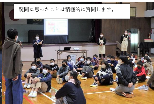
疑問に思ったことは積極的に質問します。