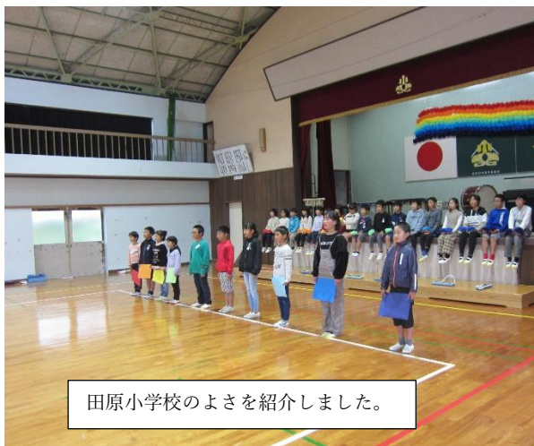
田原小学校のよさを紹介しました。

例年なら、高千穂町内の学校が参加しての開催なのですが、今年もコロナ感染予防対策として各学校での撮影となりました。子どもたちはこの日のために、休み時間も練習して、素晴らしい演奏を聴かせてくれました。何かを成し遂げる達成感を味わったことでしょう。