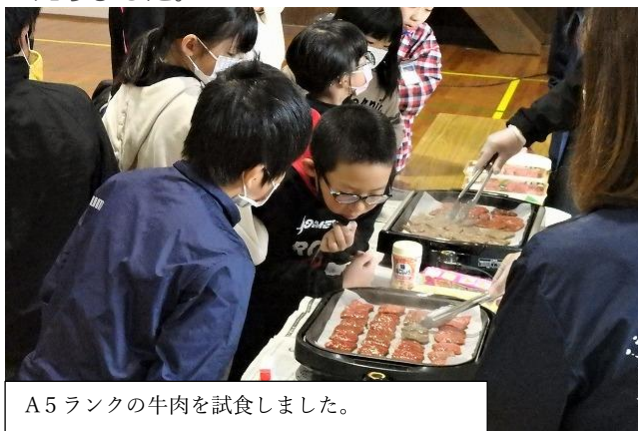
A5ランクの牛肉を試食しました。