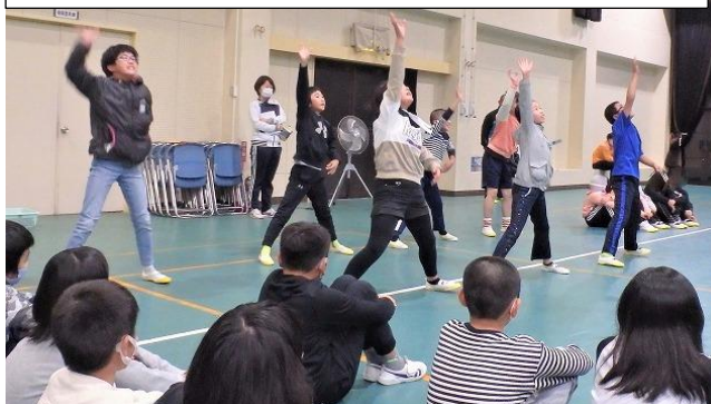
学校紹介では、運動会で行った、ソーラン節を披露しました。