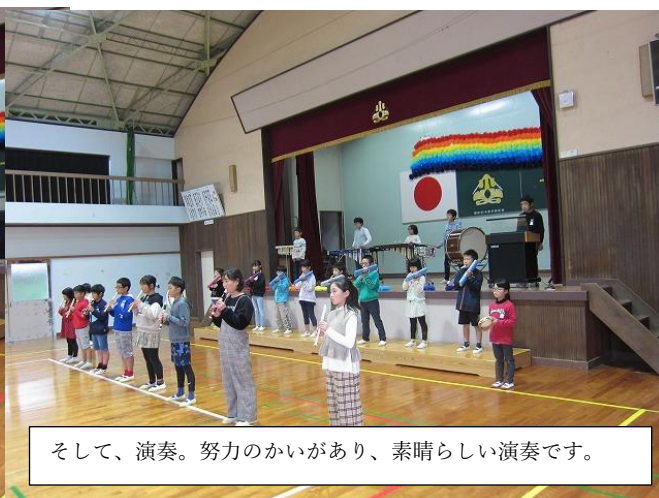
そして、演奏。努力のかけがあり、素晴らしい演奏です。