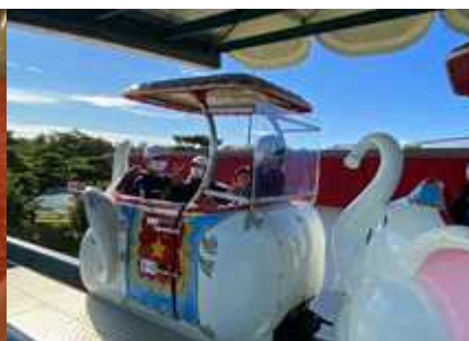
【動物を見るより乗り物の方が楽しいかも！】