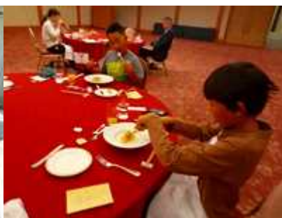
【豪華なディナーに舌鼓】