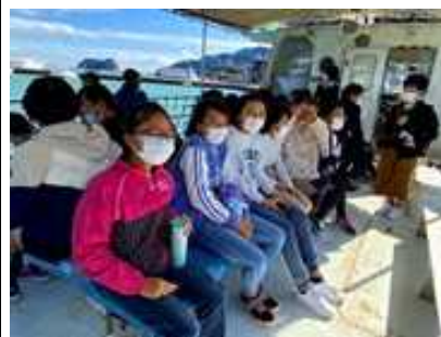
【船の上は少し寒かったかな？】