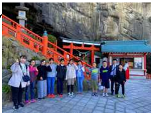
【鵜戸神宮でハイポーズ！】

11日(木)、12日(金)に1泊2日の修学旅行を行いました。少し天気が心配されましたが、日頃の行いのおかげか何とか雨も降らなかったようです。コロナの影響で、今年度も1泊2日で県内での修学旅行となりましたが、楽しい思い出をたくさん作ってきたようです。シェラトンホテルからの太平洋の眺めは最高だったことでしょう。とにもかくにも無事に全員帰校できて良かったです。