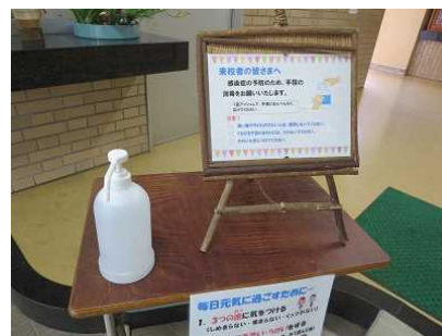
【アルコール消毒の設置】

毎日「健康観察カード」を提出してもらっていますが、時々忘れてくる児童がいます。忘れることがないように、声かけをお願いいたします。なお、学校で児童が発熱した場合には、家庭科室で待機させますので、連絡がありましたらお迎えをお願いいたします。ご理解とご協力をよろしくお願いいたします。