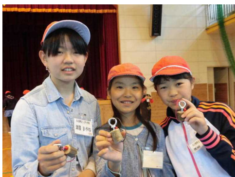
【物作り活動の様子】