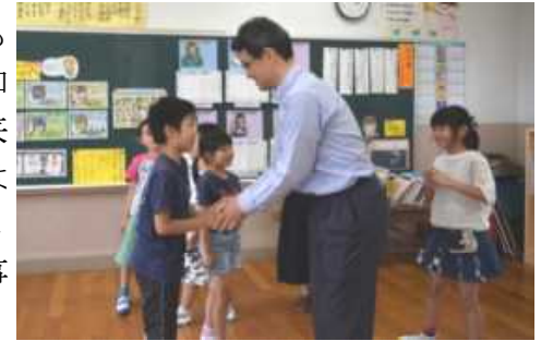
【視察に来られた河野県知事】