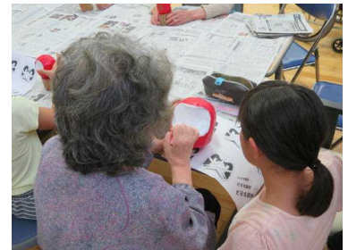
【一緒にだるまの顔描き】