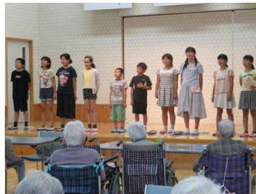
【歌を披露する子どもたち】

自己紹介、合唱や合奏の披露の後、子ども達は高齢者の方と一緒にだるま作りをしました。この日は、だるまに顔を描く活動をしました。子ども達は高齢者の方に優しく接しながら、顔の描き方を教えていました。