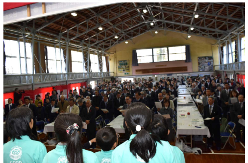
【子どもたちと校歌を歌う出席者の皆さん】

私は、八戸小を囲む会の様々な場面で感動しましたが、その一つが、第一部の最後に出席された皆さんと子どもたちが一緒に歌った「校歌」です。校歌の素晴らしさ、大切さを再認識しました。