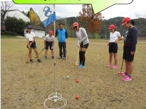
【グランドゴルフを楽しむ5・6年生】

5・6年生は、クラブ活動でグランドゴルフをしています。まだ、始めたばかりですので、上手とは言えませんが、練習を重ねるごとに上達してきており、時には好プレイが飛び出し歓声があがっています。また、珍プレーが度々あり、学校中に子どもたちの明るい声が響いています。