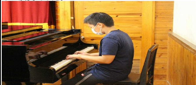
■聞く態度も素晴らしいです■

校歌の伴奏をしてくれたのが、6年生です。練習をしっかりとってくれました。間違いもなく、素晴らしい演奏でした。