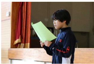
【結団式】 みんなまだよそよそいです！