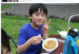
【カレーづくり】 自分たちで火をおこし、調理！