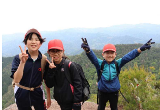
【矢筈岳、丹助岳登山】 安全に気をつけて元気に！