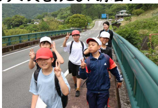
【HYツアー】 調べた「よかとこ」をみんなに紹介します！