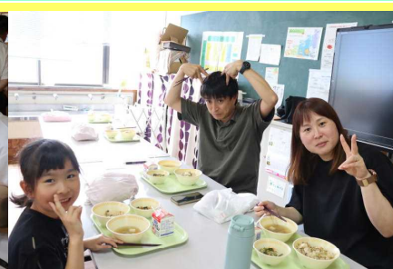
【給食試食会(1年)の様子】