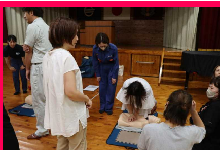
【心肺蘇生法講習会の様子】