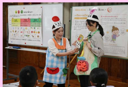
【「食と命」の授業の様子(1~4年)】