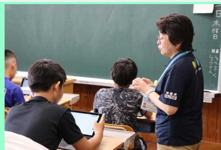
【「SOSの出し方」の授業の様子(5,6年)】