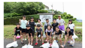
文責；校長 三浦哲至