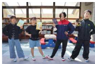
集会・図書委員会