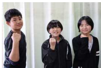
給食・保健委員会