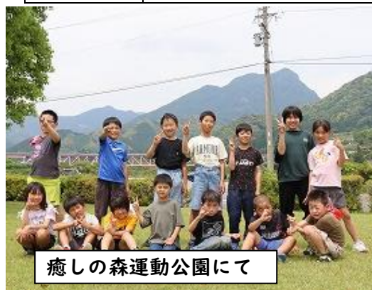
癒しの森運動公園にて