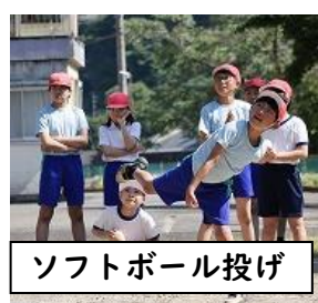
ソフトボール投げ