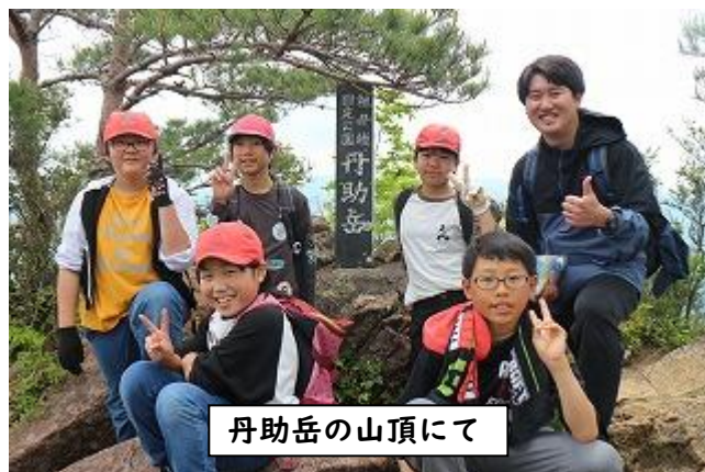
丹助岳の山頂にて

15日（木）と16日（金）は、5年生の宿泊学習でした。1日目は、丹助岳登山と野外炊飯、2日目は木育活動とHY ツアー（ひのかげよかところツアー）がありました。2日間ともお天気に恵まれ、充実した宿泊学習になりました。5年生の一番の思い出を下に紹介します。