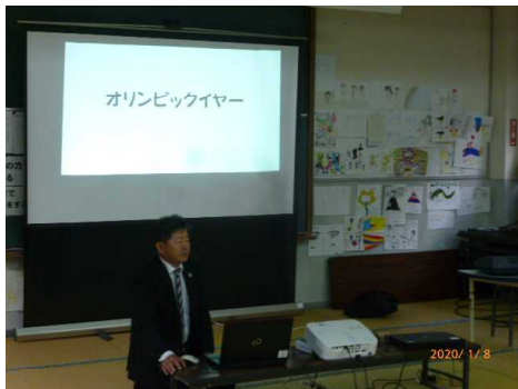
【島根校長先生の話ー夢を実現するために】