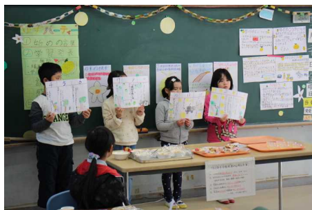
←ゆずパーティー(三、四年)