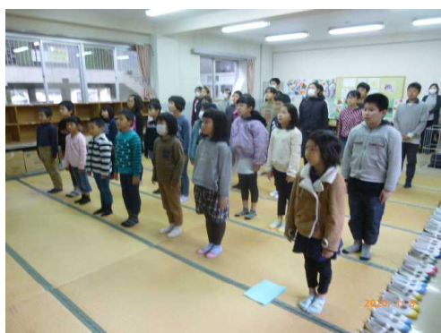
【令和2年のスタートです。】

今年も、地域の方々にはこれまで同様、日之影小学校の子どもたちの学習（体験活動）や生活の充実、そして安心・安全が確保できるようご支援・ご協力お願いいたします。