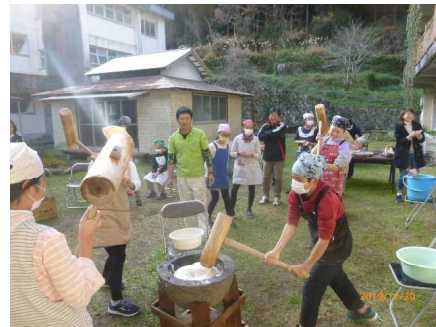
←もちつき大会(五、六年)