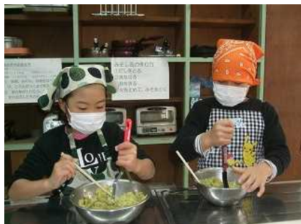
←おいもパーティー(一、二年)

今年度の成果をもとに、ぜひ来年度も農業体験を実施したい考えておりますので、今後とも地域の方々のご協力をお願いいたします。