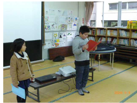
【児童代表作文発表】