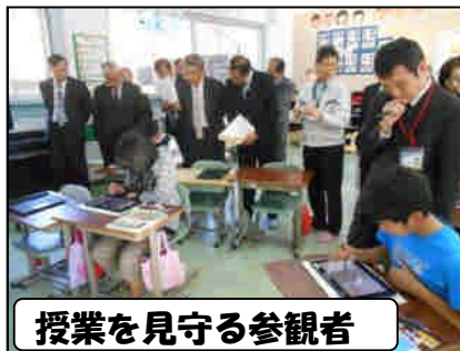
授業を見守る参観者

11月27日（木）、子どもたちが大型テレビやタブレットなどを使って学習する様子を、町議会議員や町教育委員の皆様や、先生方に見ていただきました。タブレットのいろいろな使い方が分かりました。