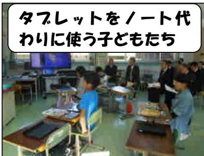
タブレットをノート代わりに使う子どもたち