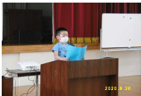
【始業式：児童代表作文発表】