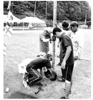
みんなで前日準備