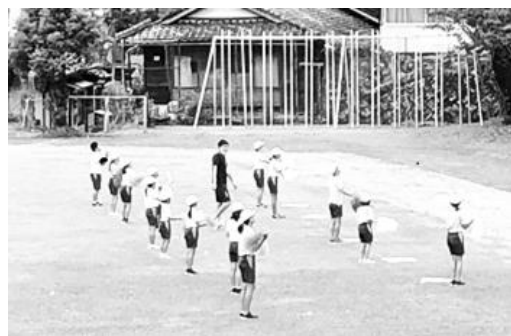
昼休み時間を使 っての応援練習

運動会当日の様子は、見ていただいたとおり、また、前述しましたとおり素晴らしい結果でした。ここでは、当日に至るまでの様子（当日では見えない部分）の一部をご紹介します。