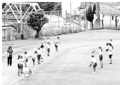
自主性と創意工 夫が見えました。