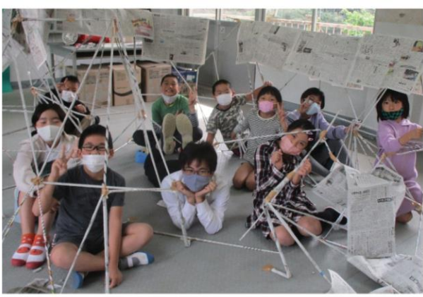
芸術の秋 3・4年生 図工「3・4年のお城」