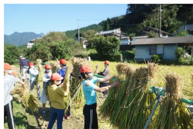
実りの秋 5・6年生 稲刈り