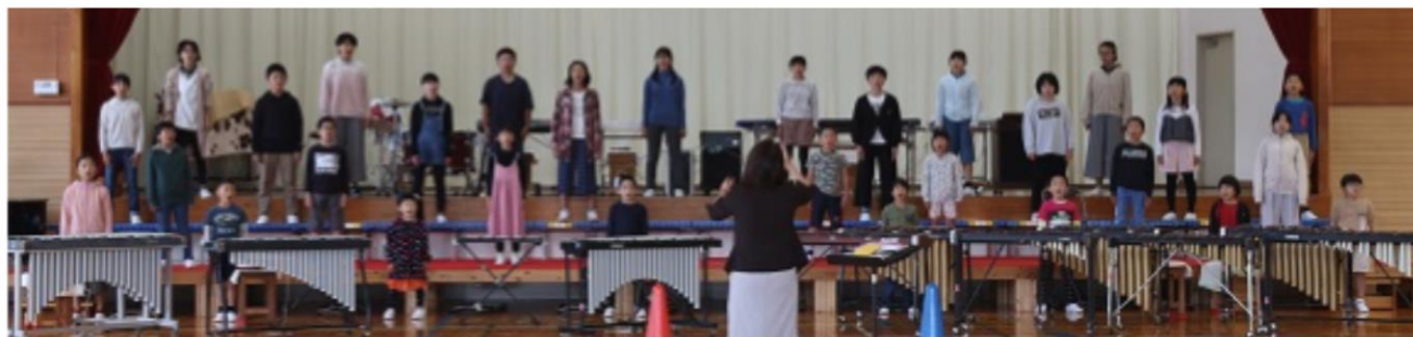
芸術の秋 全校児童 町小中音楽祭(※データ放送で放映されます。詳細は別途お知らせいたします。)