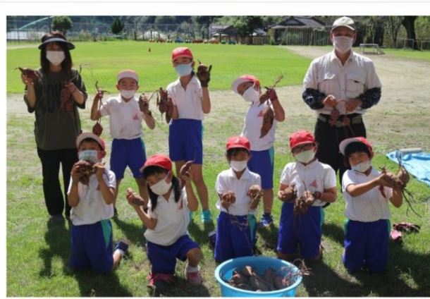
実りの秋 1・2年生 芋掘り