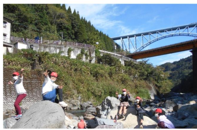
天高く子学ぶ秋 5年生 理科「流れる水の働き」