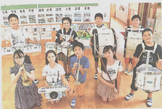
鼓笛演奏で高齢者を励まそうと、中心となりビデオレターを制作した鞍岡小6年生

鞍岡小学校の子ども達の「ビデオレター」の取組が新聞で大きく取り上げられました。これからも取り組んでいきます。素晴らしい子ども達です。