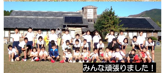
みんな頑張りました！