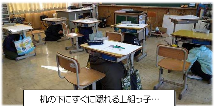
机の下にすぐに隠れる上組っ子…

◇ ◆ ◇ ◆ ◇ ◆ ◇ ◆ ◇ ◆ ◇ ◆ ※今月行った2回の「読み聞かせランド」。6人の先生方が、それぞれ絵本を選んで、読み聞かせしました。参考までに紹介します。図書室に、ほとんどの本はありますので、よろしかったら家庭でも…。