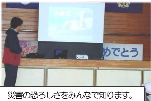
災害の恐ろしさをみんなで知ります。

13日(金)、火山噴火・津波対応の避難訓練、そしてみやざきシェイクアウト(県一斉防災行動訓練)を実施しました。避難訓練では、具体的な映像を使って担当の先生から説明があり、危機感を共有できました。シェイクアウトは抜き打ちで行いましたが、「びっくりしたけど、しっかり行動ができてよかったです。」という感想通り、子どもたちは冷静に机の下に隠れるなどの避難ができました。「今日は命を守ることを強く意識する日です。自分の命、そして周りの人の命を守るためにどうすればよいか、考え、そして行動しましょう。」と話をしましたが、さすがは上組っ子!と思わせる一日でした。