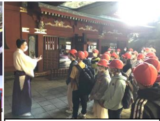
日南市の鶴戸神宮見学