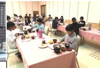
宮崎市のホテルでの夕食