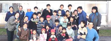
保護者の皆様、ご協力ありがとうございました。