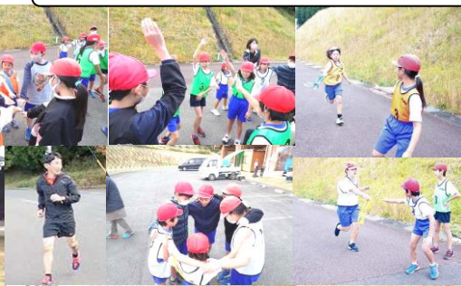
6年生は、小学校最後の駅伝大会！