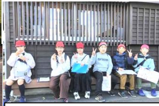
飫肥城下町での自主研修 ・・・城下町のよさを五感で堪能したようです。