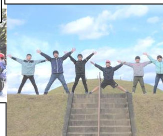
西都市の西都原古墳群