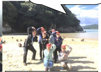
串間市の都井岬&幸島