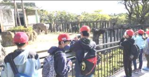
宮崎市のフェニックス自然動物園・・・宮崎県で唯一の動物園です。

宮崎県の他の市町村の「よさ」について知ることができただけでなく、五ヶ瀬町の「よさ」の再認識もできたようです。よい経験をありがとうございました。関わって下さった多くの方に感謝です。