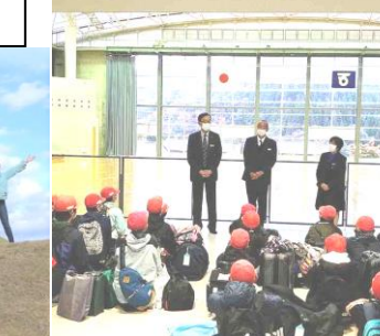
五ヶ瀬町での解散式