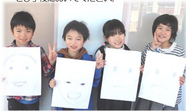
1・2年生 (はがきはありませんが、笑顔だけ送ります…)