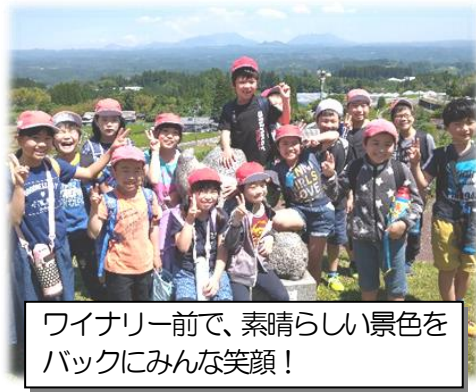
ワイナリー前で、素晴らしい景色をバックにみんな笑顔！