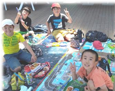
待ちに待った弁当。おいしい弁当に思わず笑顔。朝早くからの弁当づくり、ありがとうございました。