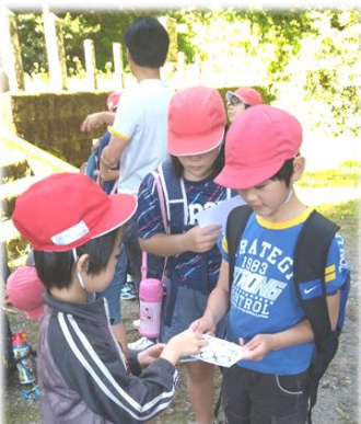
フットパスからのコースを使ってスタンプラリー