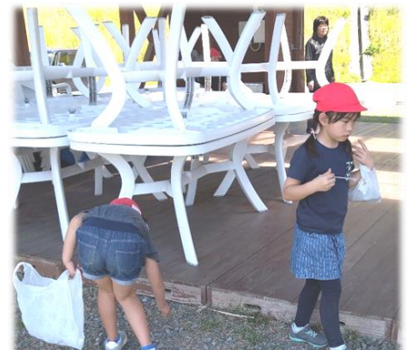
しっかりごみ拾いをしました。でもほとんどごみがありません。さすがは五ヶ瀬町です！