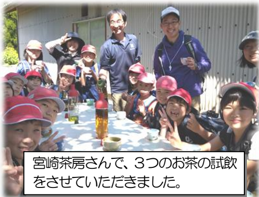
宮崎茶房さんで、3つのお茶の試飲をさせていただきました。

“人のことを考えて行動すること” “自分のことをふりかえること” の2つをしていくことが大切なことだと話をしました。さあ今日から、また自分を高めてがんばっていきましょう！