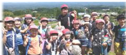
たくさんの笑顔と元気、これからも…