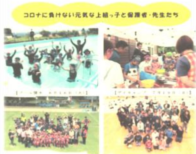
コロナに負けず元気な上組っ子と保護者・先生たち