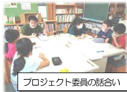
プロジェクト委員の話し合い

最後となりましたが、この1年間、おかげをもちまして、私自身、とても幸せな日々を送ることができました。これも上組小学校を応援してくださった全ての方々のおかげです。心より感謝申し上げます。ありがとうございました。今後とも引き続き、よろしく願いいたします。