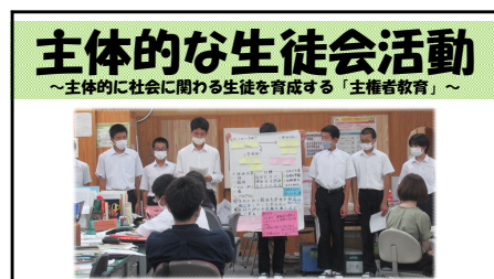
【主体的な生徒会活動】