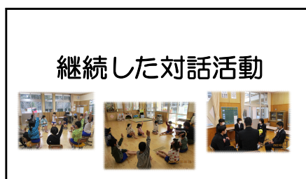
【継続した対話活動】