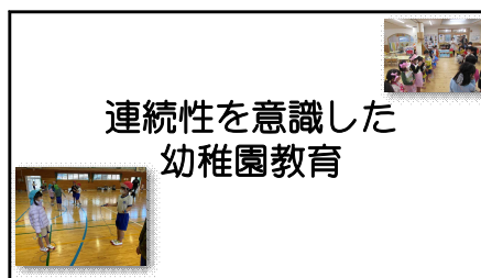
【連続性を意識した幼稚園教育】