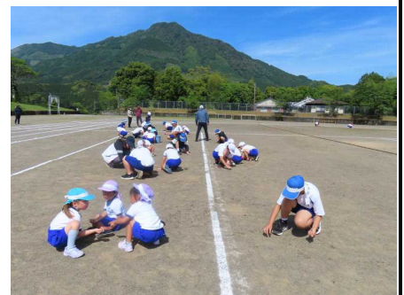
【草抜き・石拾い・フン拾いの様子】

運動会当日は、子どもたちの一生懸命な姿に感動の連続でした。真剣な表情で身振り手振りをつけて大きな声で歌う運動会の歌。最後まで全力で走る徒走。練習に練習を積み重ね、笑顔でダンスする表現活動。仲間を応援しながら必死にバトンを繋ぐ全員リレー。来賓や地域の皆さんから「一生懸命な姿が素晴らしい」「感動と元気をもらいました」と多数のお褒めの言葉をいただきました。