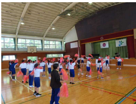
【赤団の団結の時間】

天気予報が二転三転して実施が心配された運動会でしたが何とか実施することができました。準備や練習を頑張ってきた子どもたち。運動会の前日や前々日に前期ブロックの校舎を歩いていると「校長先生、運動会はあるんですか？」とたくさんの子どもたちから聞かれました。その表情の純粹なこと。「運動会をやりたい」「運動会楽しみかしてます」という気持ちが伝わってきました。子どもたちは、本番前から練習や準備を頑張ってきました。本校では、昼休みに「団結の時間」が設定されていて子どもたちは団ごとに応援の練習をします。また、清掃の時間は生徒会の呼びかけで「ぴかぴかの運動場で走り抜けようゴールテープ」という企画で清掃活動を行いました。体育の時間の競技の練習、表現の練習、朝の会や音楽の時間の歌の練習などの積み重ねがあって感動的な運動会を創り上げることができたと思っています。