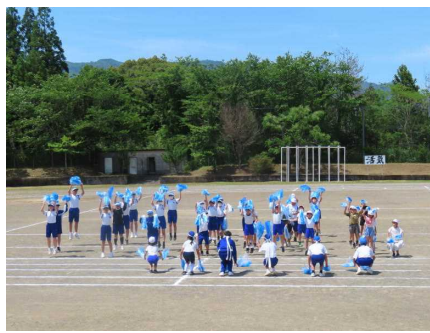
【白団の団結の時間】