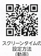
スクリーンタイムの設定方法(動画)