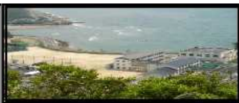
「今日が楽しく明日が待たれる学校」