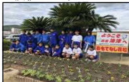
植栽ボランティア活動