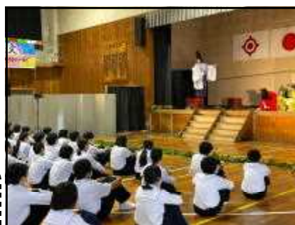
鑑賞教室の一場面