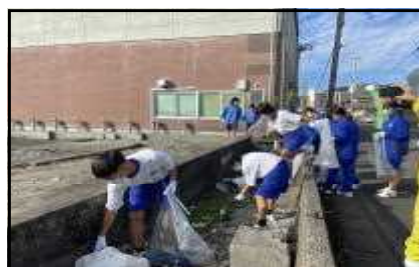
油津地区清掃ボランティア活動