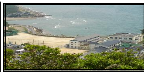
「今日が楽しく明日が待たれる学校」