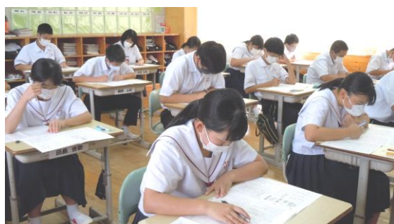
【9/1・2 校長会テストを受ける3年生】

将来、子どもが自立して生活できるように、中学校でも発達段階に応じて自分の進路を切り拓く力を身に付けさせていく必要があります。力の1つが学力であることは言うまでもありません。