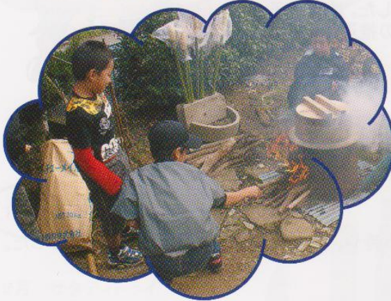
「むかごごはん」をかまどで炊く・けむたいよ～