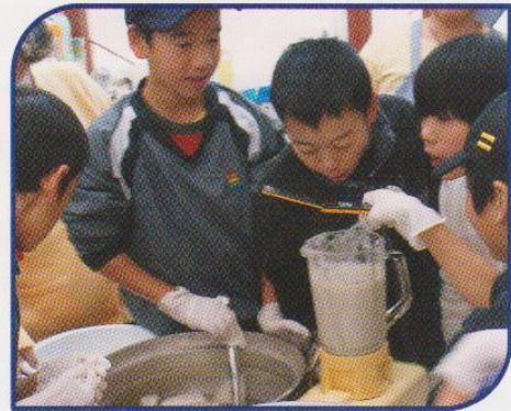
こんにゃく芋をミキサーにかける