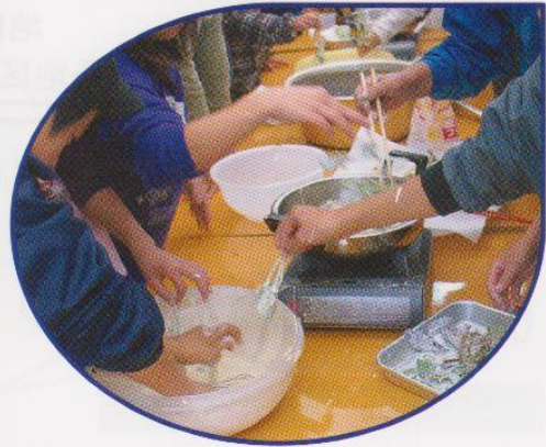
野草の天ぷら作り