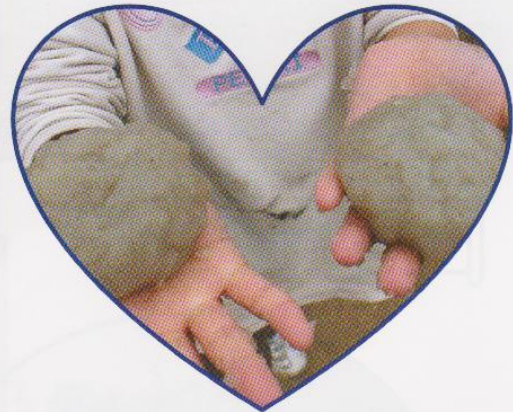
こんにゃくらしくなった