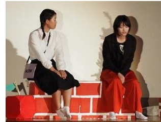
3年生 「劇」 逃亡者 ～夢を追いかけて～