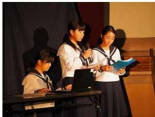
1年生 「日南ふるさと学発表」「2年生が考える 細田中の文化」

10月26日（土）に、『彩』～ 心を一つに楽しもう It's 最高の笑 time ～のスローガンを掲げ、文化発表会を行いました。今年は体育大会が10月開催だったため、あわただしい日程となりましたが、計画性を持って取り組むことができました。ステージ発表では、1、2年生の発表、英語暗唱弁論に今年はビブリオバトルも行われ、堂々とアイデアを凝らした発表をしました。また、合唱では各学年の合唱に加えて今年は全校生徒による全体合唱も披露しました。午後からは3年生による劇の発表でした。内容も素晴らしく、生徒の演技力の高さにも驚きました。その他、展示の作品も例年に比べ数も多く、力作ぞろいでした。ご多用の中、多くのご来賓、保護者の方にもご覧いただきました。ありがとうございました。