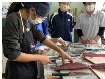
[むずかしい・・・]