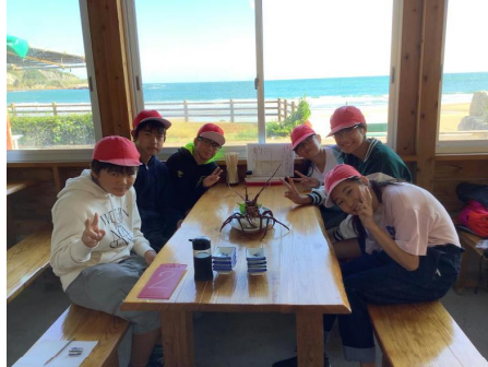
[地元の店で地産地消]