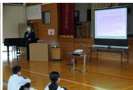
キャリア教育講演会（小学部）