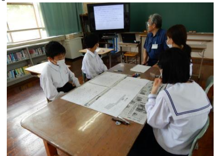
[将来の災害に備えて]