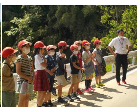
[説明をしっかりと聴きます]