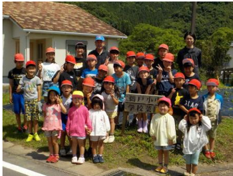
[宮浦保育園の園児と共に]