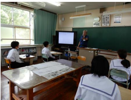
[スライドの説明を聞く]

5月24日（火）に中学部の社会科で防災授業を行いました。市役所危機管理課の方を講師に、「防災意識の高揚」のための授業を行いました。