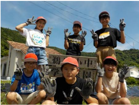
[鶴戸小中の農園にて]

5月26日（木）に、学校支援コーディネーター鶴戸支所・JA鶴戸支所の方々のご協力をいただき、宮浦保育所と小学部の子どもたちで「芋の植え付け」を行いました。収穫の際には「働いた楽しみ」が味わえることと思います。