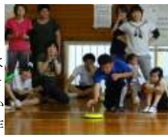
【全力投球！・・・私は常に全力です。】

「カローリング」という競技をご存じでしょうか？ 私も詳しくは知りませんでしたが・・・氷上で競技する「カーリング」の床板の上でできるものだと考えてください。今回は、小学生から中学生、保護者、先生まで全員でチームを作