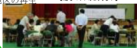
【酒谷マップのアイデアは果てしなく・・・】