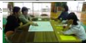
【酒谷マップ作成作業開始】

オープンスクールにご参加いただいた皆さんには、酒谷地区の再生・活性化のためのご意見をいただきまして大変ありがとうございました。生徒もいろいろなアドバイスや意見を聞き、自信とやる気をもらえたようです。