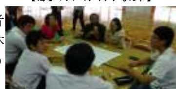
【酒谷マップはこうなる！】