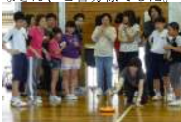
【応援一杯の中での一投。結果は・・・】