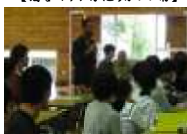
【出会者のアドバイス】