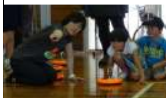
【あそこを狙って。小学生も真剣】

が思った以上に盛り上がりしました。一人が何回か投げたのですが力の加減が難しく思ったより良く転がりました。難しくてみんな真剣にならざるおえませんでした。その様子を写真で観てください。その後、P.T.Aとの楽しい懇親会をさせていただきました。役員のみなさん、ご苦労様でした。ありがとうございました。