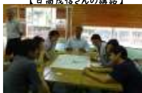
【酒谷マップは、こうがいいね】