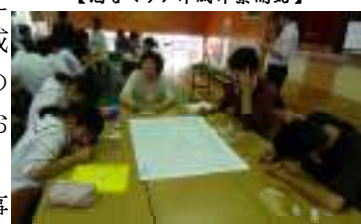
【酒谷マップのアイデア考え中】