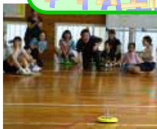
【校長先生も、この表情。真剣です】

「カローリング」という競技をご存じでしょうか？ 私も詳しくは知りませんでしたが・・・氷上で競技する「カーリング」の床板の上でできるものだと考えてください。今回は、小学生から中学生、保護者、先生まで全員でチームを作