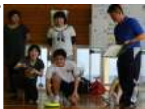
【政樹くん、頑張れ。どうかな？】