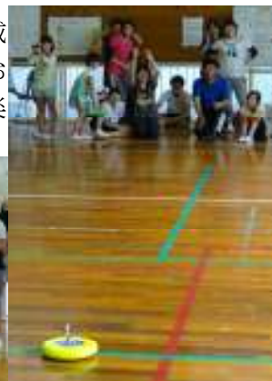
【投げたのは誰？ 喜んでるのは？】