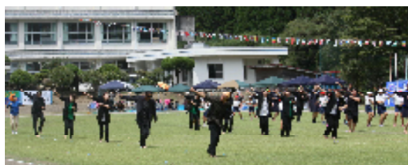
【華麗なダンスを魅せた"ホゴザイル?"のみなさん】