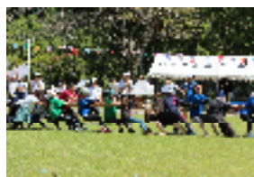
綱引き【保護者女性チーム】