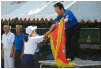
【校長先生から白団に優勝旗の授与】