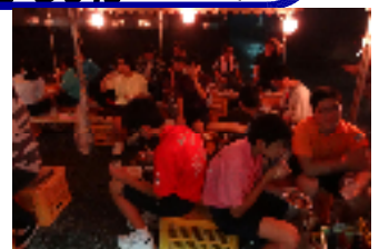
【出演後は焼き肉をいただきました】

9月27日(日)に、三区のお月見会がありました。あいにくの雨で「お月見」もできませんでしたが、公民館にて全校生徒参加で出し物をしました。「校歌」や「またいつかここで(閉校記念の歌)」を合唱して、踊りました。たくさんの拍手をい