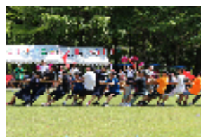
綱引き【保護者男性チーム】