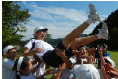
【白団団長の遙さんを胸上げ】