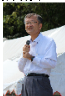
【県教育長 飛田洋様】