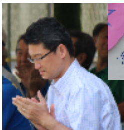
【写真の方は、県知事の河野俊嗣様でした】