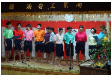
【アンコールを受けました】