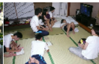
【部屋でごろごろ、くつろげる~】