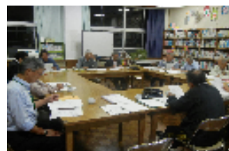
【閉校式典実行委員会の話し合い】

☆ 11月19日(木)午後7時より中学校体育館にて、「閉校に関する保護者説明会」を市教育委 員会が実施する予定です。後日案内が出ますので、是非出席くださいますようお願い致します。