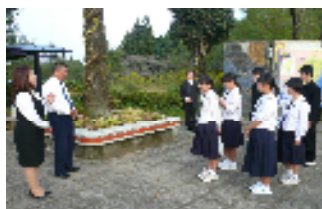
【ガイドさんと運転手さんにお礼】