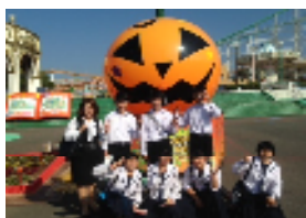
【グリーンランドで、記念の1枚】

行ってきました! 佐賀、長崎、 福岡、熊本! 2泊3日、 楽しかった! 2年生の修学旅行