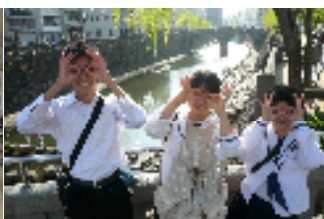
【みんな、何故か眼鏡?】