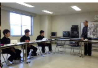
【長崎での平和学習】