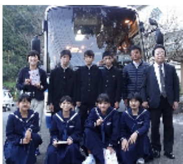
【早朝、出発前の高揚感】

2年生7名と職員3名が10月21日(水)から23日(金)までの2泊3日、バスを使っ ての修学旅行を実施しました。