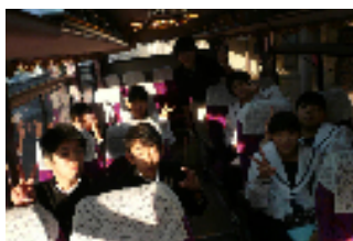
【バスの中も楽しいよ】