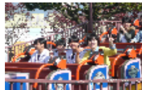
【私が1番楽しい、「イエー!」】

行ってきました! 佐賀、長崎、 福岡、熊本! 2泊3日、 楽しかった! 2年生の修学旅行