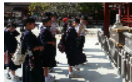
【何を願うのか、ひたすら祈る】