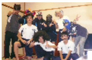
【この部屋は異常者が占拠】