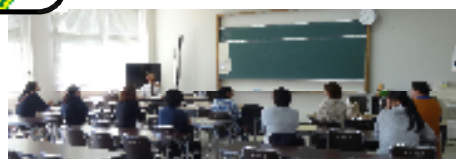
【附属中学校と高校の説明】

～ 10月28日（水）に実施した酒谷小中学校合同家庭教育学級講座に11名の参加がありました。視察先として県立都城泉ヶ丘高校・附属中学校に行きました。附属中学校は各学年とも40名の1クラスずつで、都城