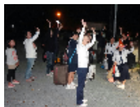
【到着後バスとのお別れ】

先日の「閉校実行委員会」では、委員のみなさん方に、 遅くまでご協力いただき、ありがとうございました!