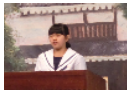
【暗唱の部で、1番目に発表】