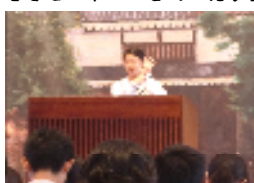
【酒谷と自分について発表】