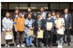
【都城泉ヶ丘附属中学校玄関で】

～ 10月28日（水）に実施した酒谷小中学校合同家庭教育学級講座に11名の参加がありました。視察先として県立都城泉ヶ丘高校・附属中学校に行きました。附属中学校は各学年とも40名の1クラスずつで、都城