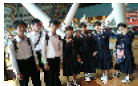
【九州国立博物館を見学】

最終日の3日目は、熊本の「グリーンランド」で先生方と一緒に十分楽しんだ後、帰りのバス の中ではぐっすりと寝ていたそうです。解散式で、お世話になった運転手さんとガイドさんにお 礼をして、酒谷中学校には午後6時半頃に到着、お迎えに来ていた家族と久しぶりの対面をした あと、みんな元気にそれぞれ家にお土産を持って帰りました。2年生のみなさん、そして保護者 の方々も3日間、大変お疲れ様でした。一生涯、心に残る思い出作りができたことと思います。