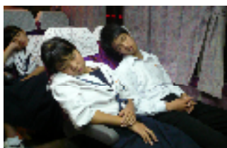
【みんな仲良く、幸せな眠り】