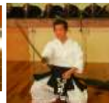
【指導者の河野先生です】