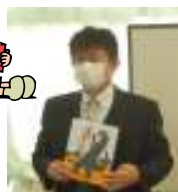
【武田先生の読書推薦】