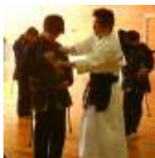
【結び方も難しいです】